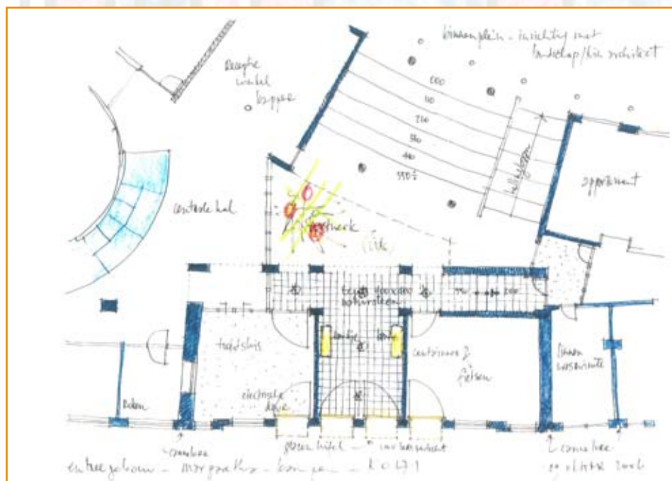
Aanpassing Broekemapand, plattegrond

Contact gegevens Verzorgingshuis Margaretha Postbus 89, 8260 AB Kampen Burgwal 45, 8261 EP Kampen T (038) 385 77 24 F (038) 332 77 24 E receptie.margaretha@ijsselheem.nl www.ijsselheem.nl/margaretha